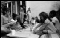
Mobiles Atelier Kunstkiosk