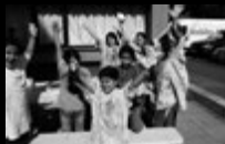
Mobiles Atelier Rostocker Straße