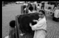
Mobiles Atelier Bibliotheksplatz