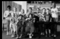
Orchester Grundschule Auf den Heuen