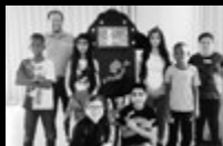
Kamishibai international Oberschule Ohlenhof