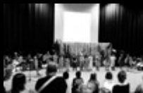
International School of Bremen