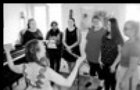
Mädchenzentrum – Ein Ort für Mädchen