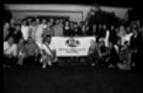
Mädchen- u. Jungengruppe der Mevlana Moschee