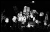
Herbstferienprojekt im Atelierhaus Roter Hahn