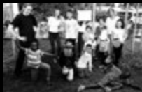
Kunst und Sprache Gröpelinger Heerstraße