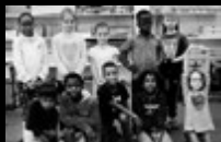
Theater AG Grundschule Auf den Heuen