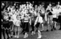
Аз съм Българче