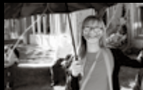
GSW / Geschichten unterm Schirm